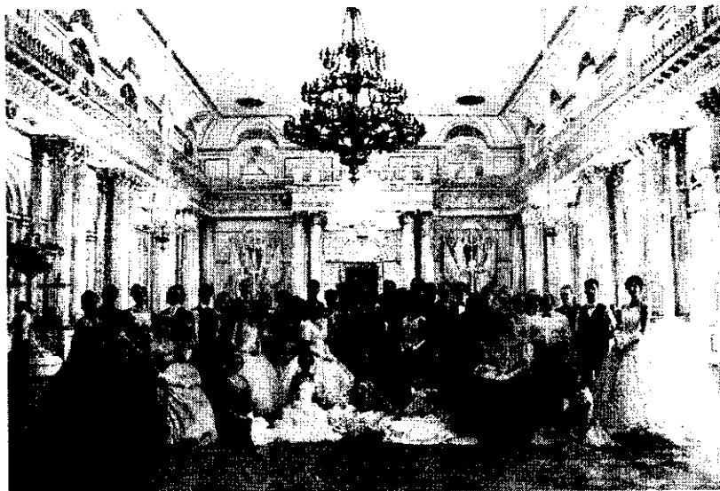
Делегация фонда «Надежда» в Государственном Эрмитаже. Март 2017 года. Санкт-Петербург.

Приоритетными направлениями Фонда является возрождение исторических традиций России (поэзия, балы, привитие молодежи навыков светского общения, поддержка и развитие творчески одаренных людей, в том числе инвалидов).